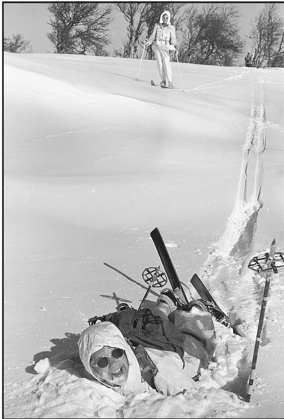
Eigentlich beste Bedingungen – trotzdem gehörig auf die Nase gefallen...

Das Siegerprojekt fand für diese Aufgabe eine überzeugende Lösung, fünf in der Mitte durch eine Halle verbundene Türme, die bis zu neun Geschosse hoch sind. Als unregelmäßiges Fünfeck ist der Bau trotz großer Masse geschickt in den heterogenen Kontext zwischen dem Hofgarten im Westen und dem lang gestreckten SoWi-Gebäude der Leopold-Franzens-Universität im Süden eingefügt. Ob dieses Ensemble jemals Wirklichkeit wird, steht momentan allerdings in den Sternen. Das MCI-Projekt wurde Anfang August dieses Jahres gestoppt, da es sich nach Ansicht des Geldgebers, also des Landes Tirol, nicht im vorgegebenen Kostenrahmen umsetzen lässt. Am 13. November ging die Landesregierung mit ihrer finalen Entscheidung an die Öffentlichkeit. Eine „detaillierte rechtliche Prüfung“ hätte ergeben, dass „eine Neuausschreibung die einzige rechtliche Möglichkeit darstellt, das Projekt unter