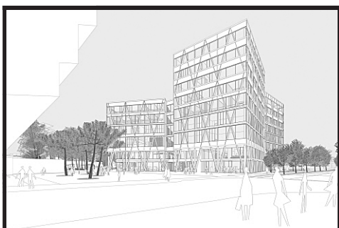
. . . MCI Innsbruck, geplant von Loudon, Habeler und Kirchwegger. [Illustration: LHK]

Die Beschuldigung der großpreussischen Blätter, Oesterreich treibe eine Politik der Rache, und in seinem Schoße niste eine dem Weltfrieden gefährdende Kriegspartei, dünkt uns nichts Anderes als ein Gewäsch von ungerechtfertigter Furcht und gehässigem Neid. Die Furcht entspringt aus dem Gefühle, das Oesterreich angethane Unrecht vor und nach dem Kriege sei so groß, daß sich vernünftigerweise auf dessen unbedingte Passivität nicht mehr zählen lasse, und der Neid erklärt sich aus dem verdunkelnden, liberalen Aufstreben Oesterreichs, der allmälig Consolidirung seiner Wehr- und Finanzkraft. Ist es ein großes Unrecht Oesterreichs überhaupt, zu existiren, so gestaltet sich dasselbe unverzeihlich, wenn dieses einer Leiche gleichgehaltene Reich gleichwohl sich anschickt, ein Auferstehungsfest zu feiern.