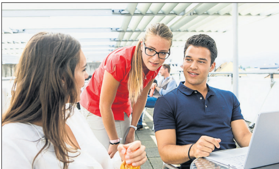
„International Business & Law“ bereitet die Studierenden für anspruchsvolle Aufgaben in Industrie, Handel, Steuer- und Unternehmensberatung, Wirtschaftsprüfung, E-Commerce, Start-ups und mehr vor.