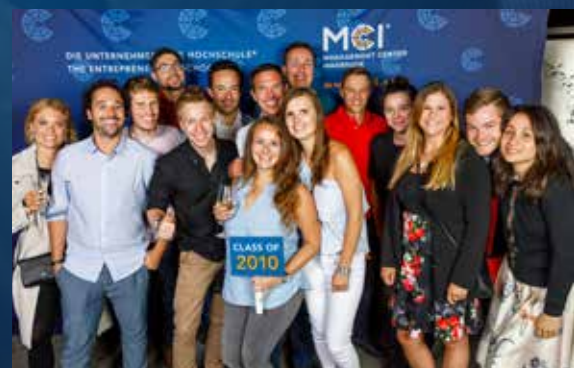
MCI Alumni Weekend