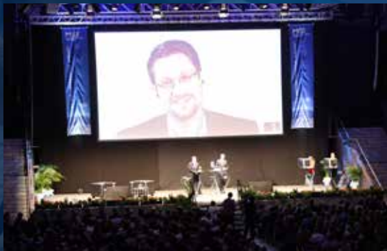
Edward Snowden Whistleblower