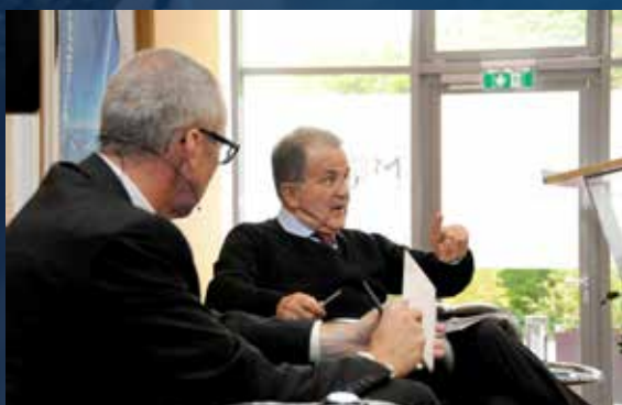
Romano Prodi , Former President of the European Commission & Prime Minister of Italy