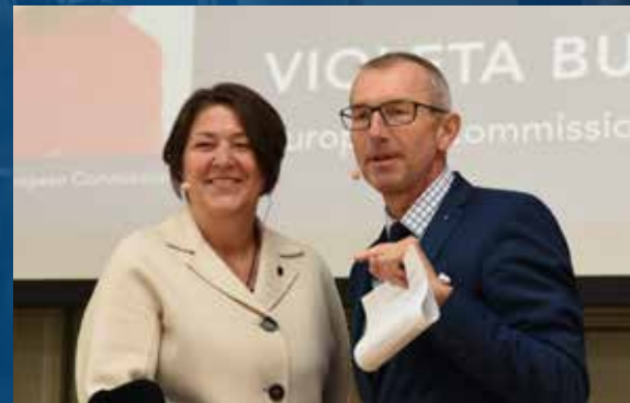
Violeta Bulc EU Commissioner for Transport 2014–2019